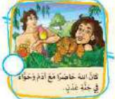
كان الله حاضرًا مع آدم وحواء في جنة عدن.